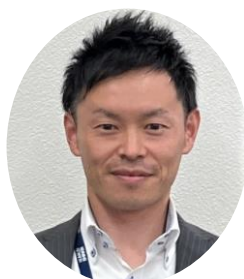
沼津信用金庫 北支店 支店長

昭和54年3月 沼津信用金庫 入庫 平成10年3月 香貫支店 支店長 平成13年3月 今沢支店 支店長 平成16年3月 高島町支店 支店長 駅北地区統括母店長 平成17年2月 高島町支店長兼五月町 駅北サテライト店店長 平成20年3月 本店長 平成22年4月 御殿場営業部長 平成24年4月 資金運用部長 6月 常勤理事就任 平成27年6月 常務理事就任 平成30年6月 専務理事就任 令和3年8月 理事長就任