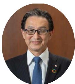
沼津信用金庫 理事長